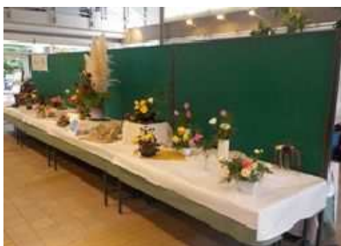
みどりの展示会「秋のバラ展」 (長久保公園都市緑化植物園)