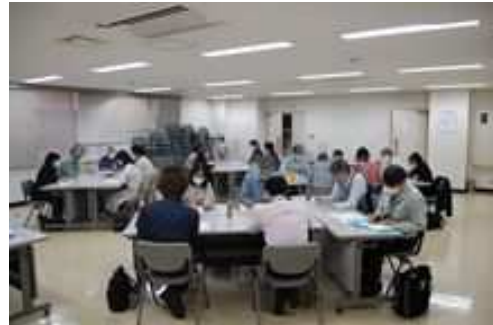
情報セキュリティ研修