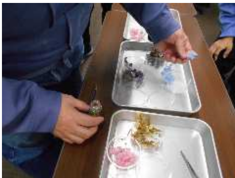
障がい者会員を対象とした技能講習会 ハーバリウム