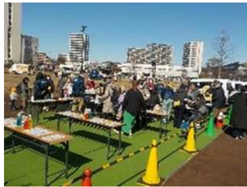
早春の神台公園まつり (神台公園)