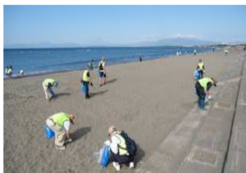
海岸清掃ボランティア