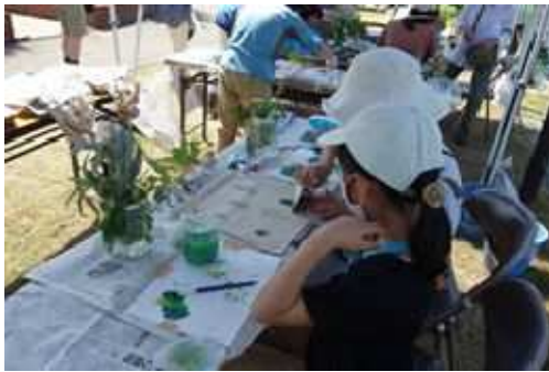
ハーブフェスティバル (長久保公園都市緑化植物園)