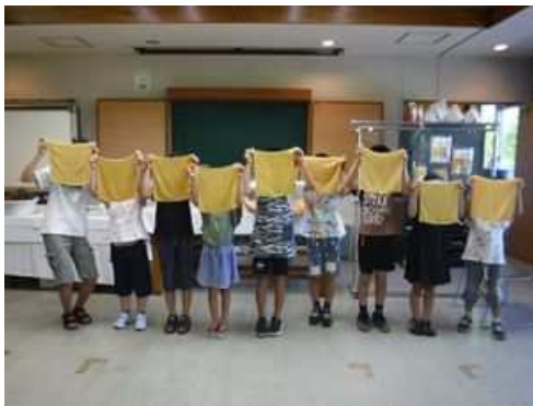
染め物講習会 (引地川緑地)