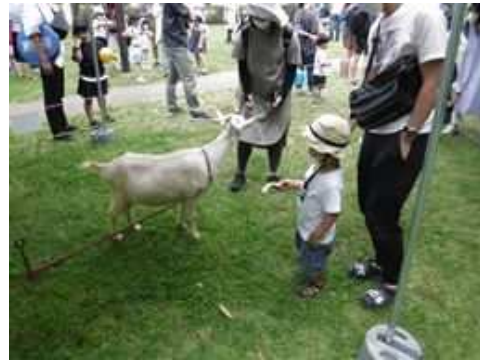
第14回引地川親水公園まつり② (引地川親水公園)