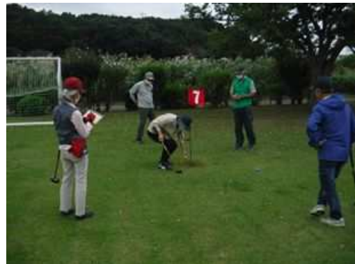
パークゴルフ体験会 (引地川親水公園)