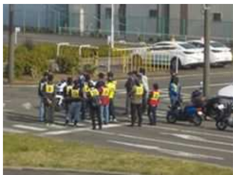
シルバードライビングスクール