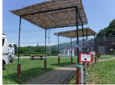
利用者の意見を反映し改良を加えたミストシャワー (引地川親水公園左岸)