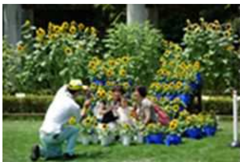
長久保スターマイン「ヒマワリフォトスポット」 (長久保公園都市緑化植物園)