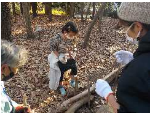
カントリーヘッジ作り (長久保公園都市緑化植物園)