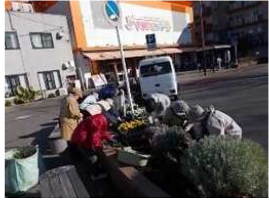
長後花いっぱい運動推進委員会と本協会の公園管理担当の職員が、協働で実施した植栽枠への草花植栽作業 (長後駅東口)