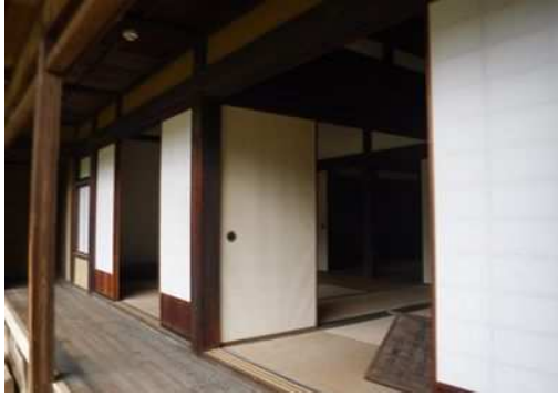
利用者の意見を反映した古民家の襖・障子張り替え (新林公園)