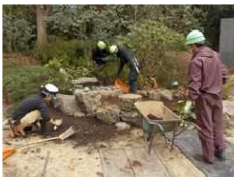
庭園見本園に水琴窟を協働で設置作業 (長久保公園都市緑化植物園)