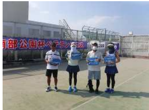
ベテランテニス大会 (辻堂南部公園)