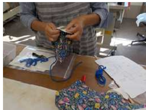
市民及び女性会員を対象とした技能講習会 リバーシブル巾着の製作