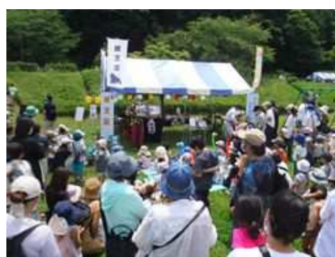
第14回引地川親水公園まつり① (引地川親水公園)