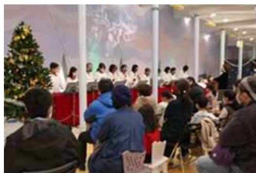
ワークショップ催し物「ハンドベルコンサート」 (湘南台文化センターこども館)