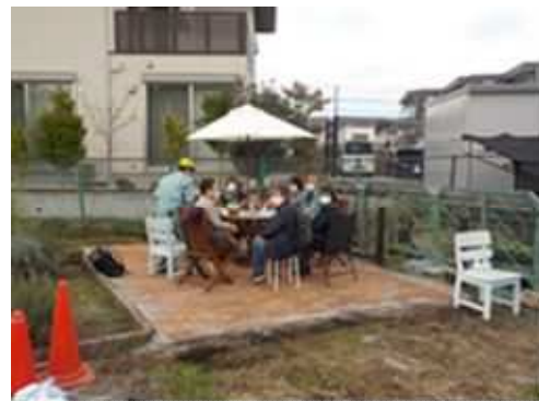
洋風ガーデンを作ろう (長久保公園都市緑化植物園)