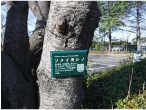
植物の特性が瞬時に検索できるQRコード付き樹名板 (桐原公園)