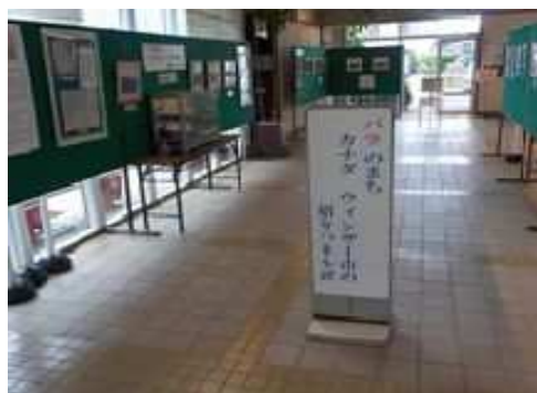
みどりの展示会「カナダウインザー展」 (長久保公園都市緑化植物園)