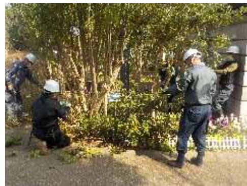
長久保公園で開催した植木剪定スキルアップ講習会