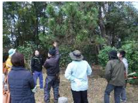
樹木の手入れ講習会 (大庭城址公園)