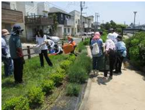
みどり香るまちづくり整備 (引地川緑道)