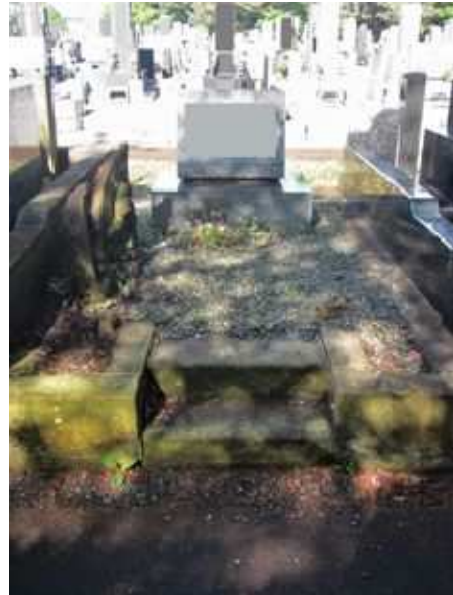
繁茂対応前と対応後 (大庭台墓園)