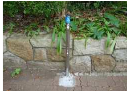
利用者の意見を反映しトイレ横にリードフック設置 (長久保公園都市緑化植物園)