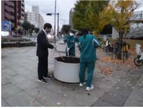
湘南台高校ボランティア部の生徒と本協会の公園管理担当の職員が、協働で実施した花壇手入れ (湘南台公園)