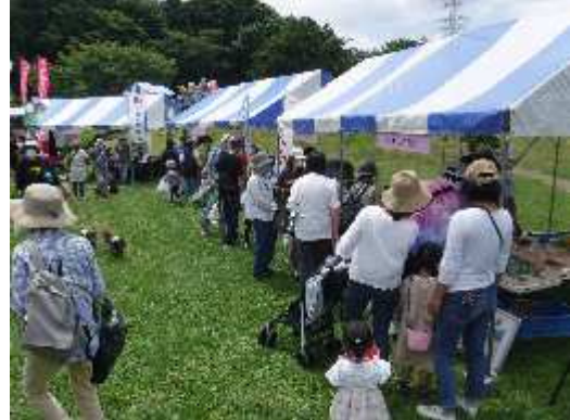
第14回引地川親水公園まつり (引地川親水公園左岸)