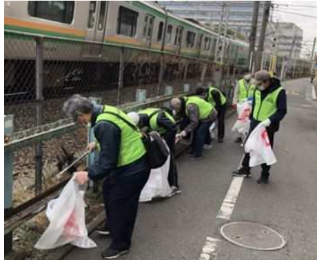
藤沢駅南口周辺清掃 ボランティア