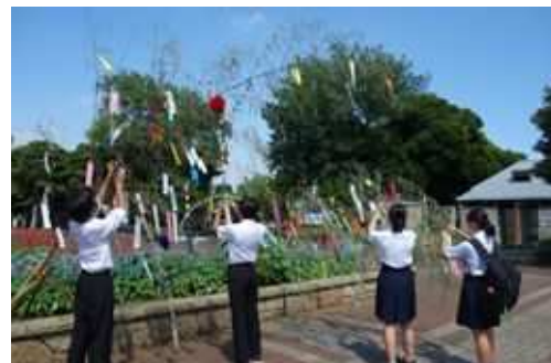
長久保の七夕 (長久保公園都市緑化植物園)