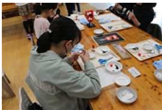
お正月ワークショップ講座「羽子板作り」 (湘南台文化センターこども館)

ソ 引地川親水公園まつりにおいて地産地消の推進や観光名産品等の普及促進を目的とした地域の団体等を支援することで、市民の交流と地域の活性化を図った。