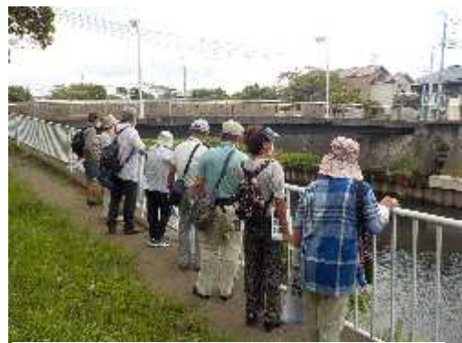
夏の自然観察会 (長久保公園都市緑化植物園)