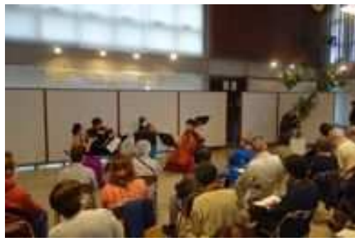
ちいさな秋のコンサート (長久保公園都市緑化植物園)