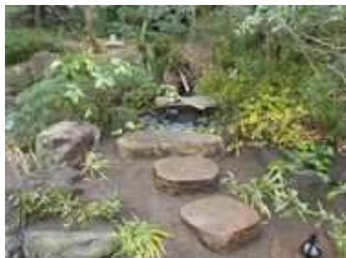
庭園見本園に水琴窟を協働で設置完了 (長久保公園都市緑化植物園)