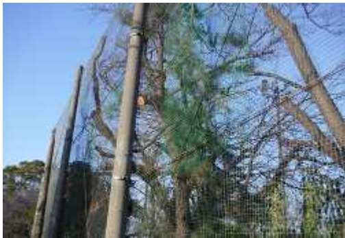
利用者の意見を反映した野球場外野フェンスの補修状況 (桐原公園)