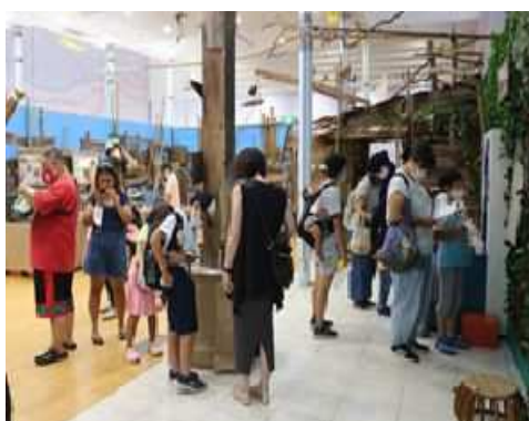
夏休み特別企画展 (湘南台文化センターこども館)

なお、長久保公園及び遠藤笹窪谷公園の次期指定管理者については、公募による選定審査が行われ、当協会は選定されませんでした。利用者へのサービスの継続性と安定性の確保に十分に配慮し、藤沢市及び次期指定管理者への業務の引継ぎを行いました。