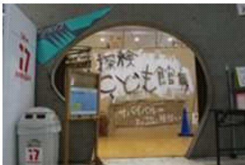
夏休み特別企画展 (湘南台文化センターこども館)

イ 長久保公園都市緑化植物園展示ホールにおいて、企画展や写真展、緑化愛好団体による植物作品展を開催するとともに、公民館写真サークルの協力を得て公園・街路樹等の写真展を開催した。10月には、新たに「秋のバラ展」を開催した。