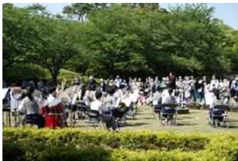
春のみどりと花のまつり「羽鳥中学校吹奏楽部」 (長久保公園都市緑化植物園)