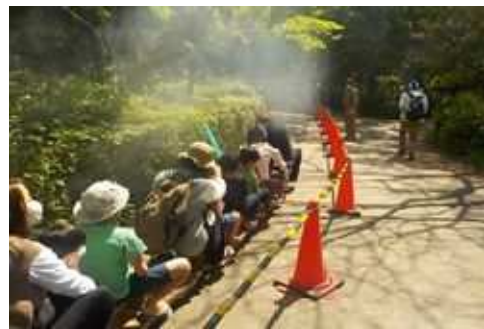
春のみどりと花のまつり「ミニ鉄道にのろう」 (長久保公園都市緑化植物園)