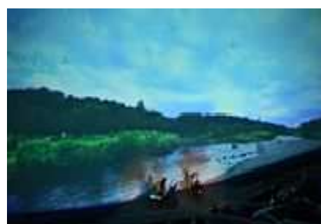
プラネタリウムコンサート (湘南台文化センターこども館)