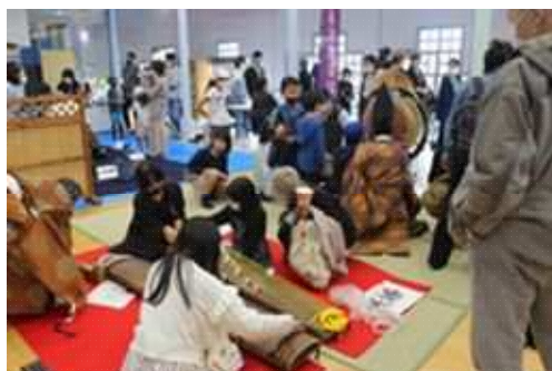
湘南台まつり (湘南台文化センターこども館)